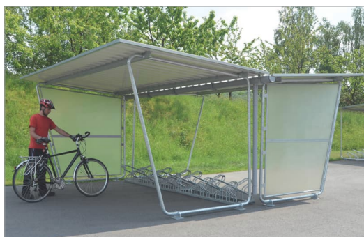
Model Siegen S28 Základní jednotka, oboustranná Na přání se dvěma polyesterovými bočnicemi, dešťovým žlabem se svodem a systémem pro parkování jízdních kol.