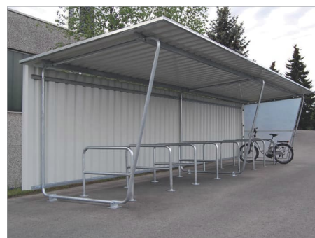
Model Siegen S18 základní a S19 přídatná jednotka. Volitelně se zadními stěnami a boční stěnou z polyesteru, dešťovým žlabem a systémem pro naklání jízdních kol.