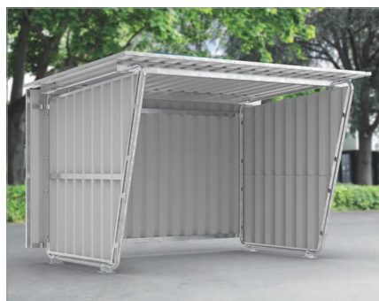
Model Siegen S17 Základní jednotka Volitelná verze se zadním panelem a dvě boční stěny z trapézového plechu.