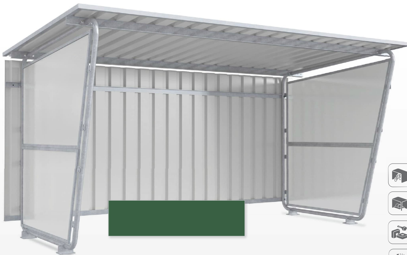
Příklady modelů Siegen S18 Volitelně se zadní stěnou a 2 bočními stěnami.