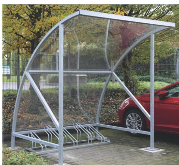
Model Bamberg B16 pozinkovaný, volitelně se 2 bočnicemi a stojanem na kola.