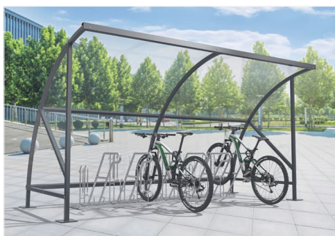
Model Bamberg B18 v barevném provedení RAL 7016 antracitově šedá. Volitelně se 2 bočními stěnami a systémem pro parkování jízdních kol.