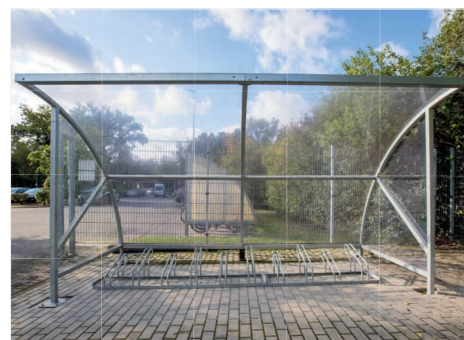
Model Bamberg B18 pozinkovaný, volitelně se 2 bočnicemi a stojanem na kola.