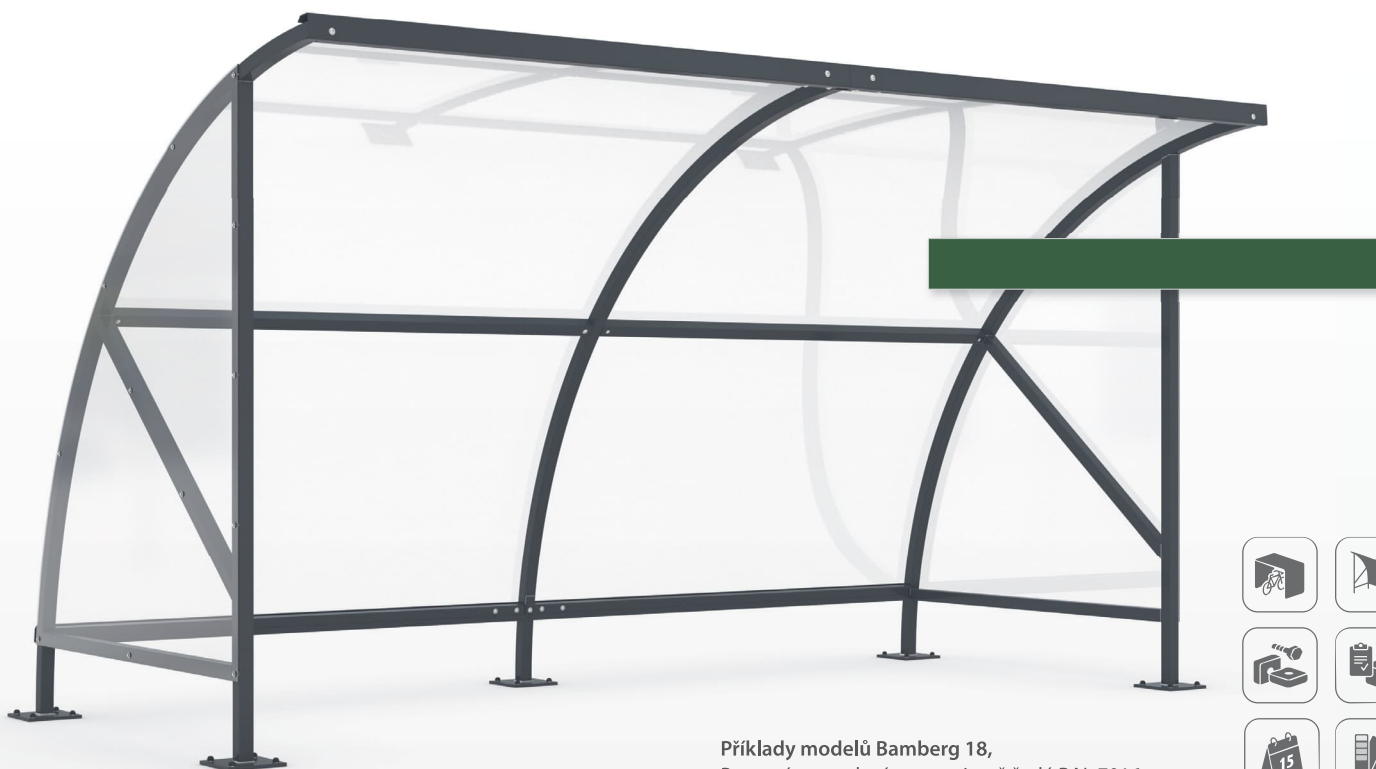
Příklady modelů Bamberg 18, Barevné provedení v antracitově šedé RAL 7016. Volitelně se 2 bočními stěnami.